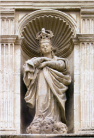
Gaspar Blai promogué la construcció de la capella de la Puríssima. Figura de la Mare de Déu en la façana principal renaixentista de l'Església arxiprestal de Santa Maria. Ontinyent.

L'associació cultural La Nostra Terra vol sumar-se a la commemoració del 400 aniversari del naixement del p i autor del Sermó de la Conquesta de la molt insigne ciutat de València Gaspar Blay Arbuixech (Agullent 1624-València 1670).