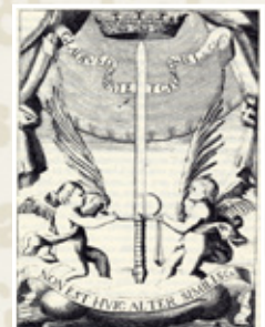
Il·lustració del Sermó de la Conquesta. Sermó de la Sancta Conquista de Valencia y de la augusta espasa del senyor Rey Don Jaume.