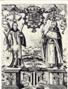
Il·lustració del Sermó de la Conquesta. Sermó de la Sancta Conquista de Valencia y de la augusta espasa del senyor Rey Don Jaume.