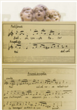
Col·laborador en el naixement de l'acte dels Angelets.