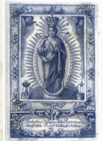
Intervingué en la restauració de la imatge de la Puríssima. Imagen de la Puríssima Concepción, patrona de la Villa de Onteniente. Tomás de Rocafort. 1822. Gravats a l'aiguafort.