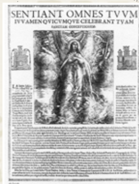
Fou predicador de les festes de la Puríssima. Cartell del programa de festes de 1662. Jeroni Vilagrassa.